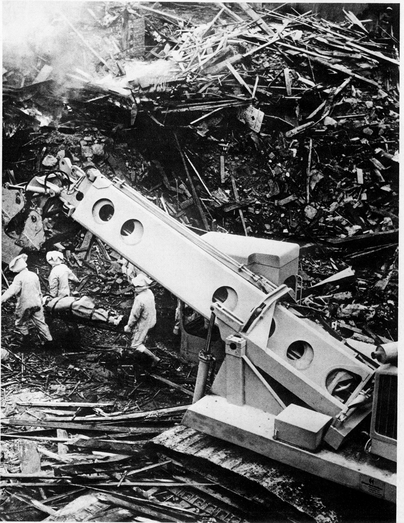
Luftschutztruppen bei Aufräumarbeiten und bei der Bergung von Verwundeten nach einem Katastrophenfall.