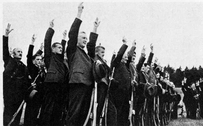
Alte und junge Jahrgänge werden als Angehörige der lokalen Ortswehren vereidigt.

Wie verhält es sich heute? Wir stellen ein nachlassendes Interesse für unsere Landesverteidigung fest, je größere Anstrengungen und Opfer diese – soll sie ernst genommen werden – von uns verlangt. Ist dies einmal mehr der kräfte- und kostensparenden Saumseligkeit desjenigen zuzuschreiben, der nicht daran erinnert zu werden wünscht, daß das betuliche Dasein und Wohlbefinden auch einmal ein Ende nehmen könnte? Oder ist es nicht vielmehr so, daß wir inmitten unerhörter technologischer Entwicklung, tiefgreifenden sozialen Wandels uns befinden und daß die Armee nach Form und Ziel erneut aus dem Gleichgewicht mit der Umwelt geraten ist, woher dann die Spannungen rührten, denen wir in zunehmendem Maße ausgesetzt sind? Dies müßte dann eigentlich heißen, daß eine neue, die vierte Phase der Entwicklung unseres Wehrwesens eben begonnen hätte und daß wir gut daran täten, davon möglichst bald Notiz zu nehmen.