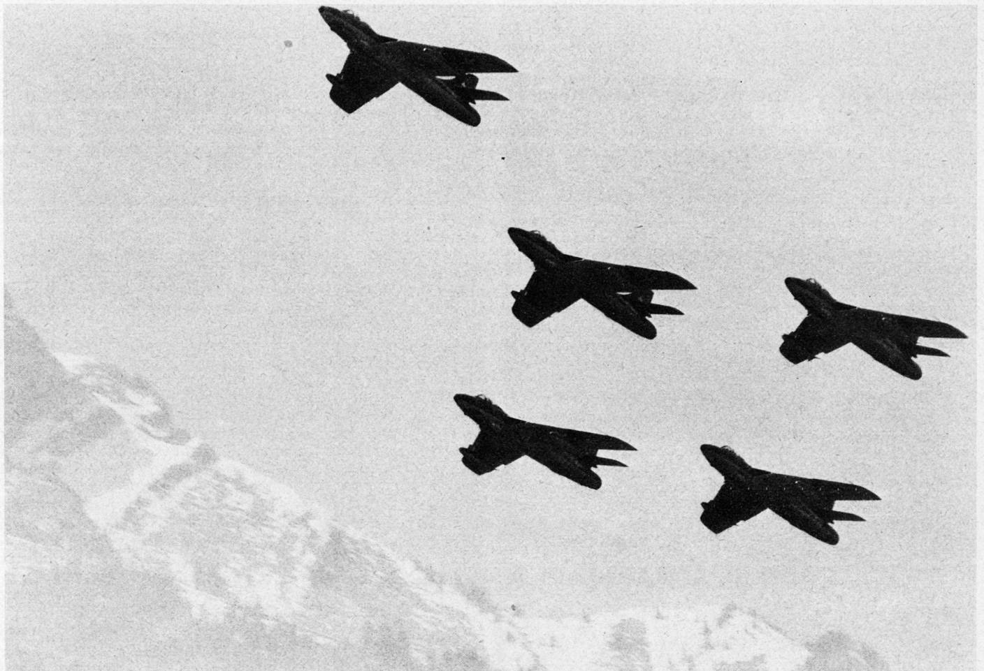
Bild 4. Die «Hunter» der «Patrouille de Suisse» im Formationsflug.

Dieser vorzüglich organisierte Pressetag beim Überwachungsgeschwader hat einen ausgezeichneten Eindruck hinterlassen. Vergleiche mit dem Können ausländischer Flugwaffen sind ohne weiteres möglich. Das Überwachungsgeschwader schließt dabei sehr vorteilhaft ab.