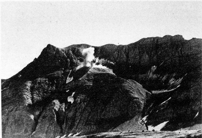
Bild 5. Bombenangriffe auf Ziel A.