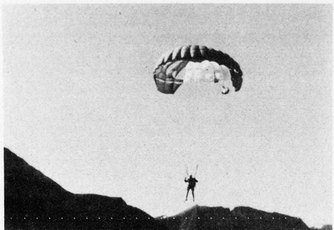
Bild 6. Absprung eines Fallschirmjägers

Den dritten Teil der Vorführungen bestritt die I. Fsch Gren Kp. Die Grenadiere zeigten ihre Sprungtechnik aus dem Hoch- und Tiefflug in voller Kampfausrüstung im Gebirge. Ihre Sprünge waren äußerst genau, wozu natürlich auch die günstigen Windverhältnisse beigetragen haben mögen.