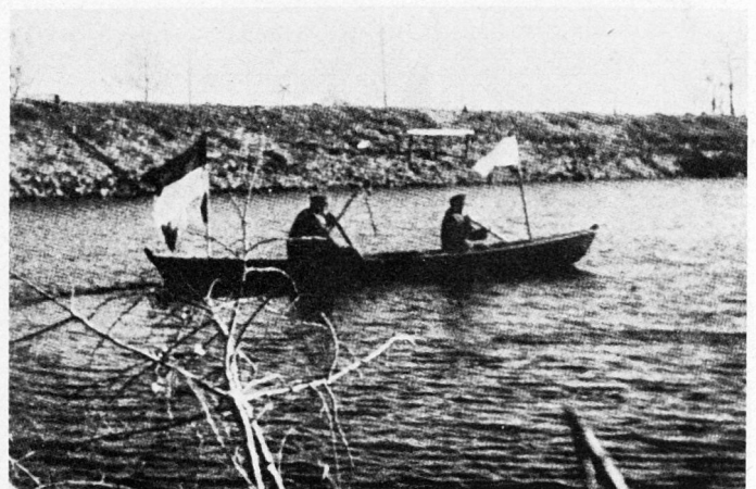
Bild 8. Überfahrt der Parlamentäre.