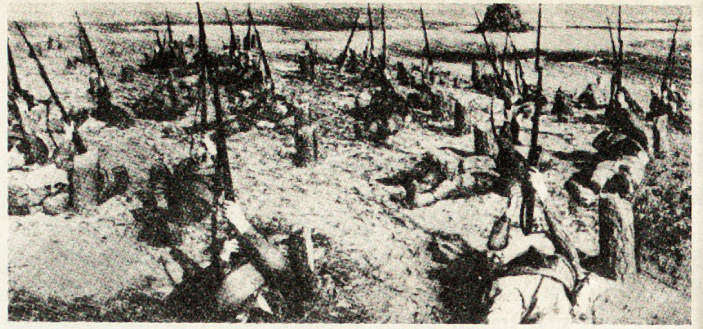
Bild 1. Schützenfeuer – wie im Ersten Weltkrieg! – gegen deutsche Flugzeuge an der Südwestfront, Mai 1942.

Aber im August 1939 begann kein Krieg zwischen der Sowjetunion und dem Deutschen Reich. Gerade das Gegenteil geschah: Stalin schloß mit Hitler einen Nichtangriffspakt, der noch im Herbst desselben Jahres zu einem Freundschaftspakt erweitert wurde. Die gesamte ideologische Arbeit innerhalb der Roten Armee mußte nun der Kehrtwendung der sowjetischen Politik gelten. Alle Angriffe gegen Hitler und seine Partei in Presse, Rundfunk, Film und Theater wurden eingestellt: «antifaschistische Filme» und Bücher verschwanden aus den Kinoprogrammen und Bibliotheken 8 . Am 23. August 1940, am ersten Jahrestag des Paktes, schrieb die «Prawda»: «Die Unterzeichnung des Paktes hat der Feindschaft zwischen Deutschland und der Sowjetunion ein Ende gesetzt, einer Feindschaft, die durch die Kriegsstifter künstlich erzeugt wurde ... Nach dem Zerfall des