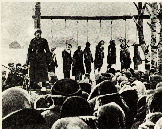
Bild 2. Kundgebung in Wolokolamsk am Hinrichtungsort von acht Partisanen (20. Dezember 1941).

Nein, dieser Krieg ähnelte keineswegs der Vorstellung der politisch und militärisch Verantwortlichen von 1939! Umsonst wartete man auch unter anderem auf eine «Revolutionierung» der «deutschen Arbeiter- und Bauernsöhne in der Wehrmacht-uniform». Die diesbezüglichen Aufrufe der Komintern und der Politischen Hauptverwaltung blieben völlig wirkungslos. Der österreichische Kommunist Ernst Fischer, der damals in Moskau weilte und mit den deutschen Verhältnissen vertraut war, sagte resignierend: «Die deutschen Soldaten hören nicht auf russische Genossen, sie gehorchen dem Befehl deutscher Generäle. Sie folgen dem Führer 19 .»