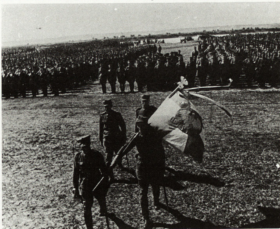
Bild 1. Eid der Kosciuszko-Soldaten im Sielce-Lager an der Oka (1943)