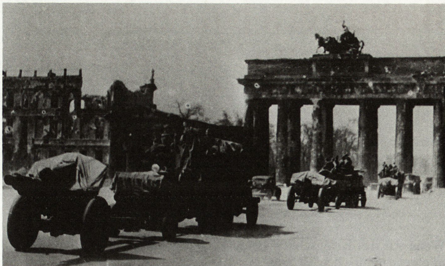
Bild 2. Polnische Artillerie vor dem Brandenburger Tor (Mai 1945)

Die Haltung des polnischen Volkes sowie die Aktivität der Partisanen im Hinterland der Ostfront zwangen den Okkupanten zeitweise zur Stationierung von 600000 bis 800000 Soldaten