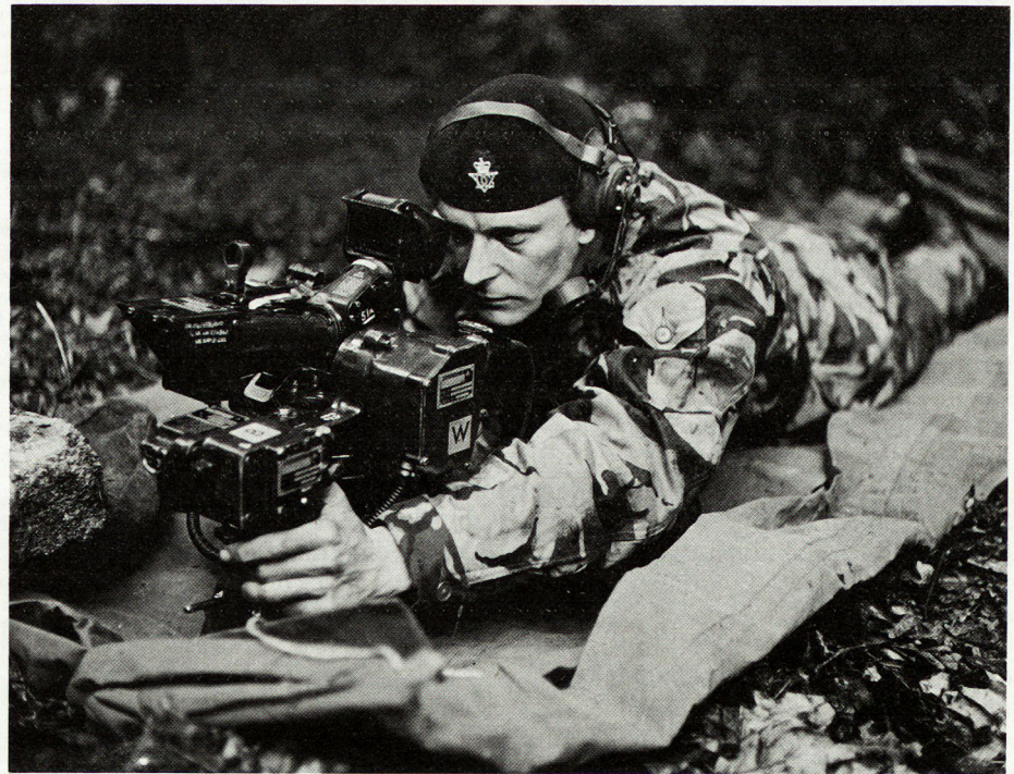
Bild 2. Britischer Schütze mit Zielgerät der drahtgelenkten Panzerabwehrwaffe «Swingfire».