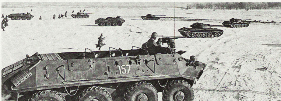
Zusammenwirken russischer Panzer und Panzergrenadiere im Angriff.

Gerade daraus erklären sich die Anstrengungen, die die USA unternehmen, um die Gefahr unerwünschter und verhängnisvoller Schäden an nichtmilitärischen Objekten zu verringern. Die Zielgenauigkeit der Einsatzmittel für taktische Nuklearsprengkörper wird wesentlich verbessert, die Sprengkraft der Ladungen herabgesetzt, so daß man sagen kann, die USA besäßen heute schon effektive Gefechtsfeld-