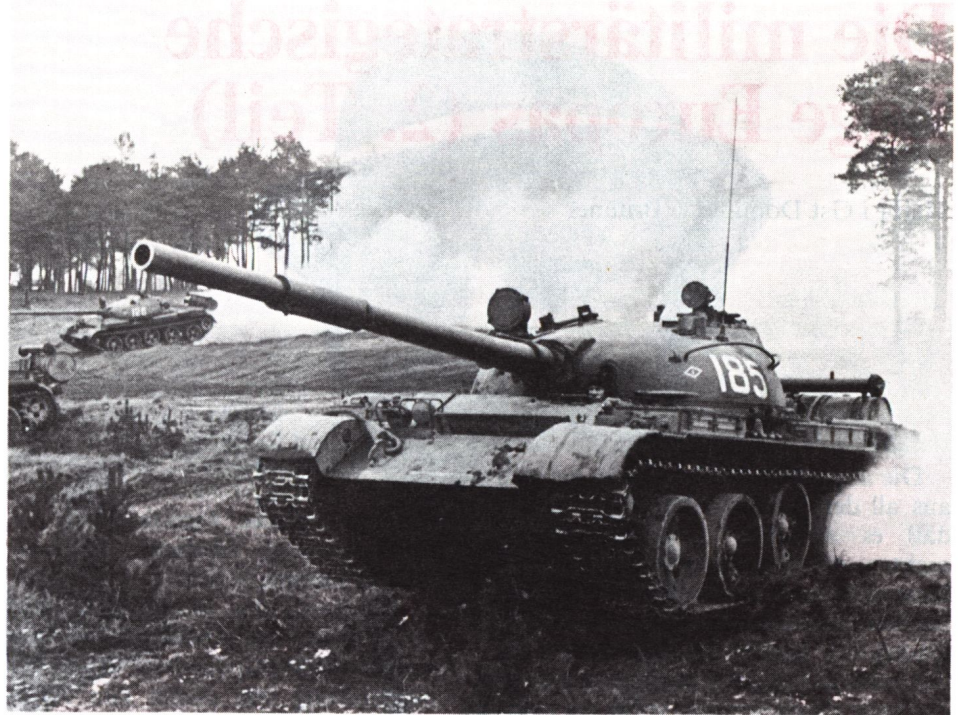
Russischer Kampfpanzer T 62, 115-mm-Kanone, tauchfähig bis 6 m.

Diese Deutung des deutschen Weißbuches steht, was die Rolle der Nuklearwaffen angeht, auf den ersten Blick im Widerspruch zur sowjetischen Doktrin , wie sie nicht zuletzt in dem in mehreren, jeweils teilweise modifizierten Auflagen herausgekommenen Werk «Militärstrategie» artikuliert ist. Diese und andere Publikationen legen großes Gewicht auf den Einsatz nuklearen Feuers im Rahmen der Landkriegführung . Die sowjetischen und verbündeten Verbände sind auch für eine prononciert nukleare Kriegführung aufgebaut, ausgerüstet und ausgebildet. Dennoch fragt sich, ob die Sowjets im Konfliktfall eine nukleare Schlacht