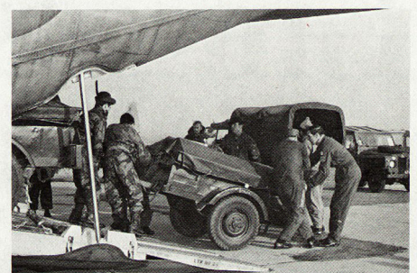
Bild 1. Italienische Gebirgstruppen beim Verlad.

In der Regel finden alljährlich und zwischen den beiden NATO-Flanken abwechselnd große Manöver der mobilen Streitmacht und übriger NATO-Verbände statt, wobei man aus politischen Gründen die unmittelbare Nachbarschaft der Sowjetgrenze meidet. Der NATO-Oberbefehlshaber in Europa delegiert die Manöverleitung an die Oberkommandierenden der jeweiligen NATO-Region und der Region Europa-Mitte. Letzterer ist für die Bewegungen der Land- und Luftkomponenten der mobilen Streitmacht zwischen ihren Basen und dem Aufmarschraum sowie für die entsprechenden logistischen Maßnahmen verantwortlich. Die Verlegung von Fliegerstaffeln gehört zur üblichen Zusammenarbeit zwischen NATO-Streitkräften.