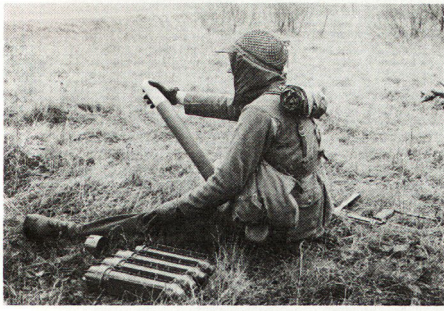
Bild 2 zeigt den Infanteristen nach dem stellungsbezogenen feuerbereit. Das Geschößgewicht beträgt 1,17 kg bei einer Länge von 340 mm. Die Anfangsgeschwindigkeit ist 114 m/s, das Geschöß wird auf 400 oder 800 m Distanz geschossen. Bei 400 m Wurfweite ergibt sich eine Auslöshöhe (der Leuchtsatz hängt am Fallschirm) von 270 m und bei 800 m beträgt die Auslöshöhe noch 240 m. Die dazugehörige Flugdauer beträgt 5,5 beziehungsweise 11,5 Sekunden, und die Brenndauer 30 Sekunden, bei einer Sinkgeschwindigkeit von 3 m/s und einer Funktionssicherheit bei Temperaturen von -40^{\circ} bis +60^{\circ} C.

Beispiel für die Beleuchtung des Gefechtsfeldes: Aus einer Höhe von 150 m ergibt das Beleuchtungsgeschöß eine Leuchtkraft von 5 lux und beleuchtet dabei eine Fläche von 630 m Durchmesser taghell, während 30 Sekunden.