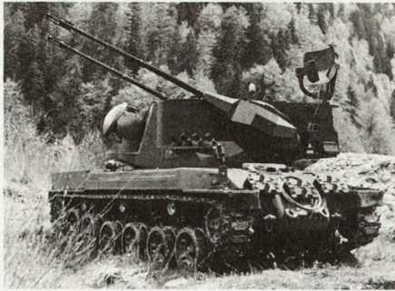
35-mm-Flabpanzer «Oerlikon-Contraves» mit Fahrgestell des Schweizer Panzers 68 (Projekt).

Aus Dringlichkeitsgründen haben die Contraves AG, Zürich, die Werkzeugmaschinenfabrik Oerlikon-Bührle AG, Zürich, die Siemens-Albis AG, Zürich, Georg Fischer, Schaffhausen, SIG, Neuhaus,