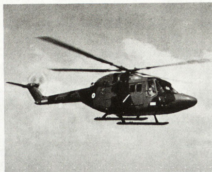
Der Helikopter Westland «Lynx»

der Visiereinrichtung. Die Flammenstöße können auf Entfernungen von 100, 120 und 140 m abgegeben werden. M. P.