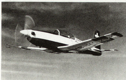
Der Pilatus PC-7 «Turbo-Trainer»

Die Deutsche Luftwaffe sucht für die Pilotengrundsicherung ein neues Flugzeug. In die Endevaluation einbezogen werden folgende Typen: SIAI Marchetti SF260M (I), Rheinflugzeugbau «Fantrainer» (BRD), Beech T-34C (USA) und Pilatus PC-7 «Turbo-Trainer» (CH). Ob der Entscheid letzten Endes von Fachleuten gefällt oder nach politischen Gesichtspunkten entschieden wird, ist eine offene Frage, sind doch Schutz und Förderung der einheimischen Industrien nicht nur Anliegen der deutschen Regierung. pb