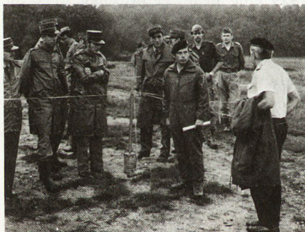
Bild: Studienreise der Militärschule II/77: Besuch bei einer deutschen Panzerbrigade.

Bedeutsam war auch die gesetzliche Verankerung von Auslandsreisen , um das Studium von Kampfspielen an Ort und Stelle zu ermöglichen und gleichzeitig die allgemeine und kulturelle Horizonterweiterung zu fördern.