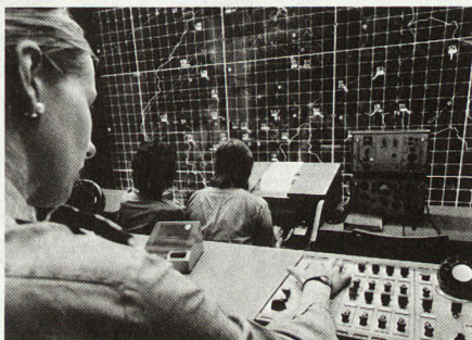
Bild 1. FHD des Fl BMD in der Auswertezentrale

Beim Kommando der Flieger- und Flabtruppen ist man sich jedoch darüber im klaren, daß der «Einbruch» der Frau in eine bisher fast vollständig männliche Welt nicht ohne Probleme vor sich gehen wird. Die Wehrmänner werden lernen müssen, die Frau in der Armee zu akzeptieren und auch ihr eine Aufstiegschance zu geben. Aufgrund der gemachten Erfahrungen wird aber jede Frau von dem Augenblick an akzeptiert, wo Können und Einsatzwillen vorhanden sind, wie übrigens im Zivilleben auch. Die