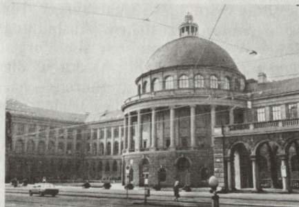
Bild 1. Eidgenössische Technische Hochschule in Zürich mit Abteilung für Militärwissenschaften

– Die Klagen über Lücken in der Instruktorenausbildung kommen von