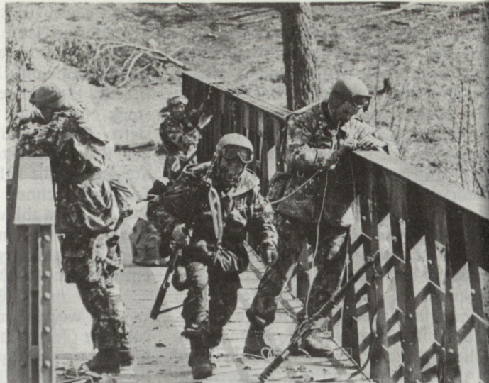
Bild 2. Mehr Fallschirmgrenadiere in unserer Armee. Hier im Einsatz zur Brückensprengung.

Material-Transport, Begleitschutz, Unterstützung, – Einsatz gegen feindliche Luftlandungen, im Anflug oder nach der Landung, – Helikopterjagd.