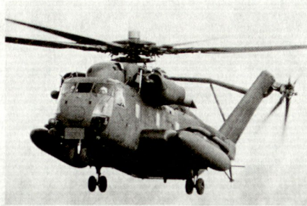
Schwerer Helikopter CH-53E Super Stallion für die U.S. Navy und das U.S. Marine Corps.

der CH-53E Super Stallion von Sikorsky, seinen Erstflug. Die Maschine ist mit drei Triebwerken ausgerüstet und kann Aussenlasten von bis zu 18 Tonnen Gewicht oder in der Kabine bis zu 55 Soldaten mitführen. Zum Einsatz wird dieser Hubschrauber bei der U.S. Navy für den Nachschub zwischen den Schiffen und den Küstenbasen, für den Transport von Bautrupps und für das Wegschaffen beschädigter Flugzeuge gelangen. Die Marines wollen ihn zur Unterstützung amphibischer Operationen und für den Materialtransport verwenden. pb