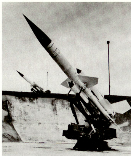
Bild 1. Wenn der Bundesrat aus politischen Gründen die Neutralität nicht erklären will, hat dies für die Flieger- und Fliegerabwehrtruppen schwerwiegende Konsequenzen.

Dies heisst mit anderen Worten, es ist Aufgabe unseres Landes, aufgrund der Praxis in den verschiedenen Konfliktsfällen, aus dem Neutralitätsrecht betreffend den Boden eigene Regeln für die Durchsetzung des Neutralitätsrechtes in der Luft zu entwickeln . Solche Regeln haben aber nicht die gleiche Bedeutung wie internationale Abkommen, da sie von anderen Staaten nicht ratifiziert und akzeptiert werden. Wir müssen also immer damit rechnen, dass andere Staaten uns Verletzungen des Neutralitätsrechtes vorwerfen, weil