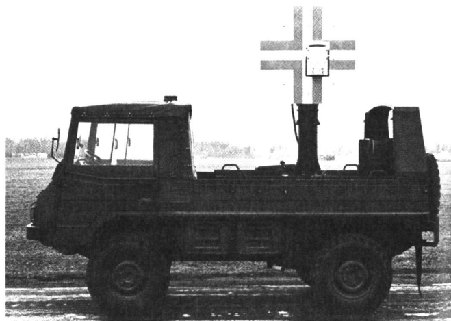
Bild 2. Zielfahrzeug mit Infrarotsender.