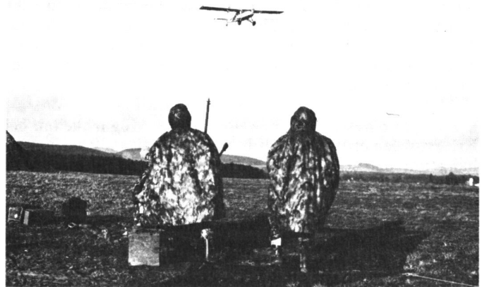
Bild 3. Sprüh-Porterflugzeug im Einsatz.

rot. Pro Einsatz können mittels 600 Liter Flüssigkeit zwei Ziele von 400 x 120 m aus einer Flughöhe von zirka 30 bis 50 m belegt werden.