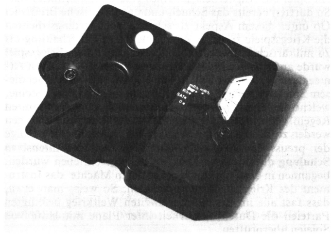
Bild 2. Empfänger, der wie ein A Spürgerät 73 aussieht.