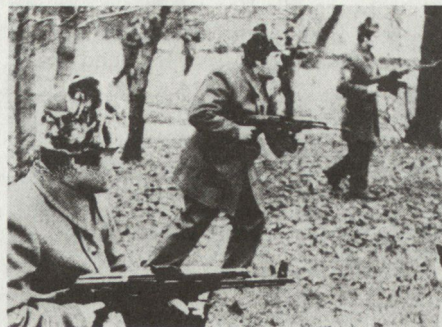
Bild 1. Patriotische Garde 1982.

Die patriotische Garde Rumäniens wurde mit denselben Maschinenpistolen wie die Streitkräfte ausgerüstet. P.G.