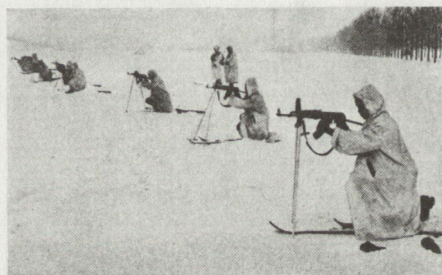
Bild 2. Die Rumänische Volksarmee in einem Wintermanöver in den Karpaten. (1981/82)