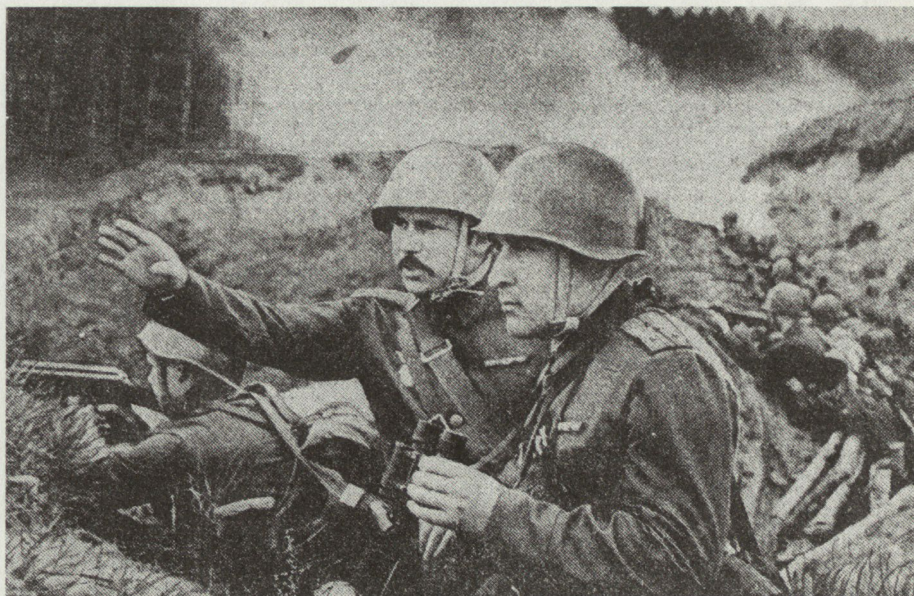
Bild 8. Die unablässige Forderung nach Initiative lässt den Schluss zu, dass die sowjetische Führung damit nicht zufrieden ist.