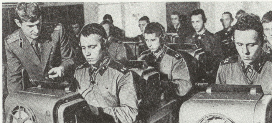
Bild 9. Die Ausbildung verlangt bei allen Waffengattungen mehr Leistung in kürzerer Zeit; auch hier gibt es Schwierigkeiten.