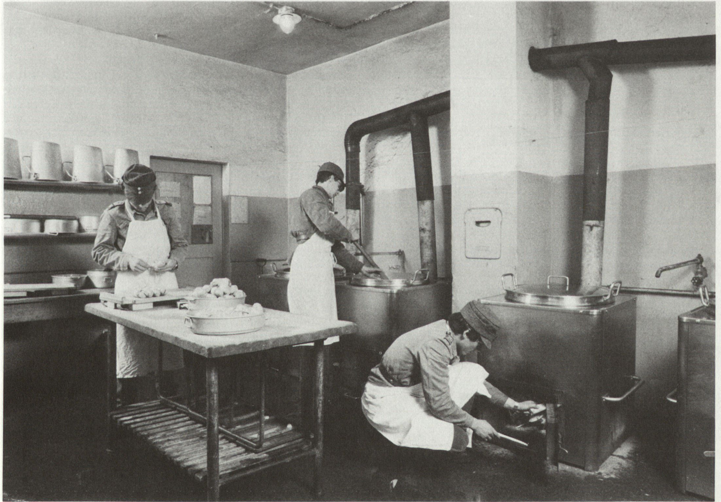
Bild 2. Truppenverpflegung aus der Gemeindeküche.

Das Verwaltungsreglement für die schweizerische Armee schreibt vor, dass die Naturalverpflegung der Truppe die Regel bilde. Zu diesem Zweck hat grundsätzlich jede Einheit einen gemeinsamen Haushalt zu führen, aus welchem die Truppe zu ernähren ist.