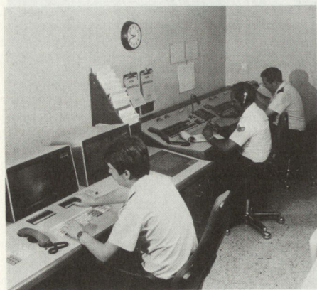
Blick in die Kurzwellen-Betriebszentrale des Projektes HF Replacement 4. ATAF (4. Alliierte Taktische Luftflotte). Im Vordergrund die zentrale Überwachungs- und Steuerungskonsole. Im Hintergrund die Kurzwellen-Überleitvorrichtung.

Das Nervensystem der Anlage ist eine prozessorgesteuerte Fernwirkanlage vom