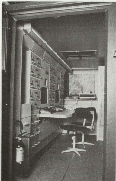
Kabine mit Schaltkoffern des ZODIAC-Systems.

Die ausbaufähige Kanalkoppelmatrix ist modular im Aufbau, wobei es sich um ein frei wählbares Netzwerk handelt. Die Hauptbedienkonsole der Vermittlungsanlage verfügt über einen Zentralrechner vom Typ MC 68 000, der ebenfalls für die «front-end»-Prozessoren benutzt wird, die Teil der Ein-Ausgabe-Karten sind. Der Speicher der Hauptbedienkonsole enthält alle erforderlichen Programme und Lesemöglichkeiten