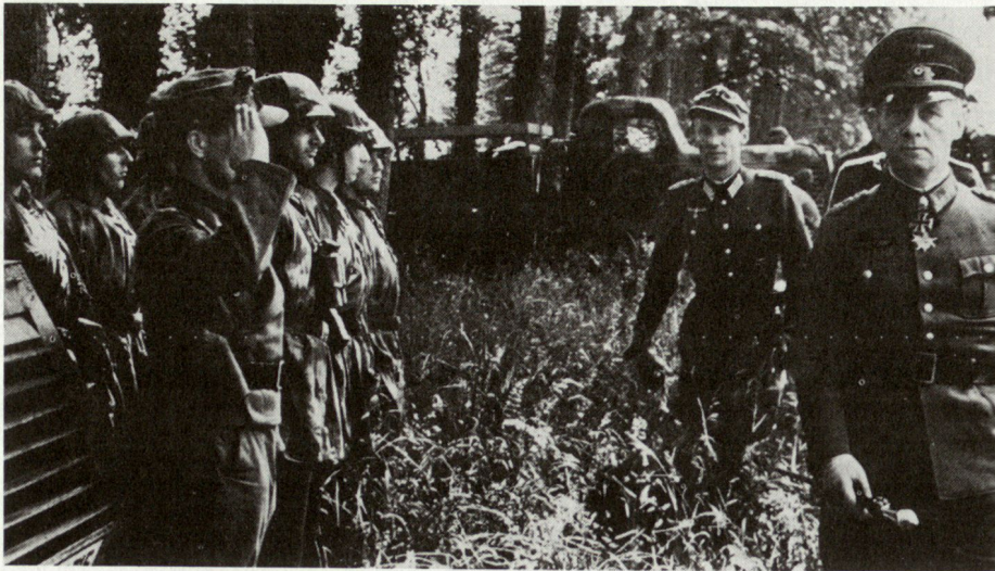
General Feldmarschall Rommel auf Inspektionstour.

716. Infanterie-Division wieder her. Als die Alliierten aber neue Luftlandungen direkt in die angreifenden Panzerverbände hinein absetzten, wurde der Angriff abgebrochen und die rückwärtigen Teile der Division freiekämpft. Die 21. Panzer-Division blieb der einzige grössere Panzerverband, der bereits am ersten Invasionsstag in den Kampf um die Küste eingreifen konnte.