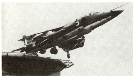
Bild 1. Start des Sea Harrier.