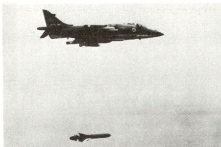
Bild 2. Abschuss der Sea Eagle.

gegen feindliche Schiffe sollen Kampfflugzeuge der britischen Luftwaffe wie der Marine bestückt werden.