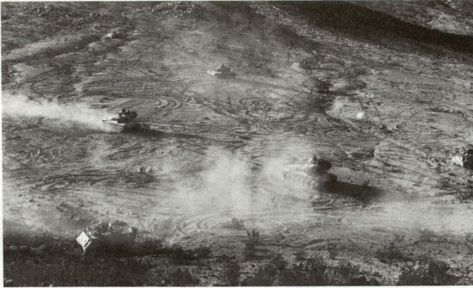
Der mechanisierte Kampf ist im Gange.

Übungen auf Gegenseitigkeit. Während der ersten 4 Tage hat sich die Truppe zusätzlich zu akklimatisieren und im schwierigen Gelände zurecht-