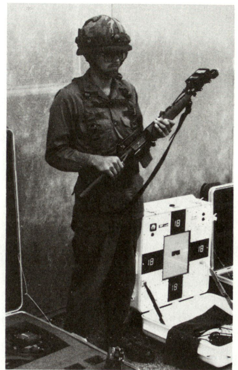
Ausrüstung mit 5 Detektoren montiert. Auf das Gewehr wird der Lasersender aufgesetzt und justiert.

Für die Darstellung des indirekten Feuers sind Petarden und Signalaraketen im Gebrauch. Minenwirkung wird mit Markierminen angezeigt.