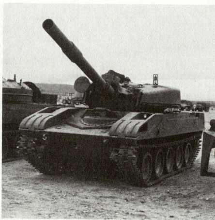
Ein umgebauter Sheridan Pz als «T-62»

Für die Übungsleitung halten TV-Kameras die Aktionen fest. Diese «Augen» bestehen aus einer Reihe mobiler Kameras und einer ferngesteuerten 4100-mm-Kamera, die von überhöhtem Standort aus in der Lage ist, einen Soldaten auf 25 km Distanz aufzunehmen. Im Computerzentrum wird die