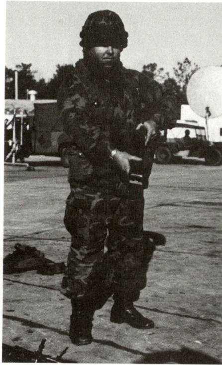
Persönliche MILES-Ausrüstung. An einem Brustharnisch sind vorn und hinten 8 Detektoren mit Stromquelle und Summer verbunden; rund um den Helm wird eine gleiche

M 113 M 2 (Kampfschützenpanzer Bradley) Panzer M 60 Panzer M 1