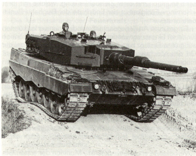
Kampfpanzer Leopard 2.

Das Leistungsgefälle zwischen unsern heutigen Panzern und denen einer neuen Generation kann durch Kampfwertsteigerungen nicht mehr ausgeglichen werden. Daher wird der Panzer 87 (Leopard 2) beschafft, welcher diese Leistungsfunktion der Zukunft übernehmen kann.