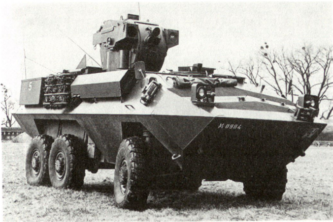
Lenk Waffen-Panzerjäger 85 (Turmvariante).

nigen Jahren in Serien fabriziert werden können. Auch die Frage einer Eigenentwicklung ist zur Zeit in Abklärung.