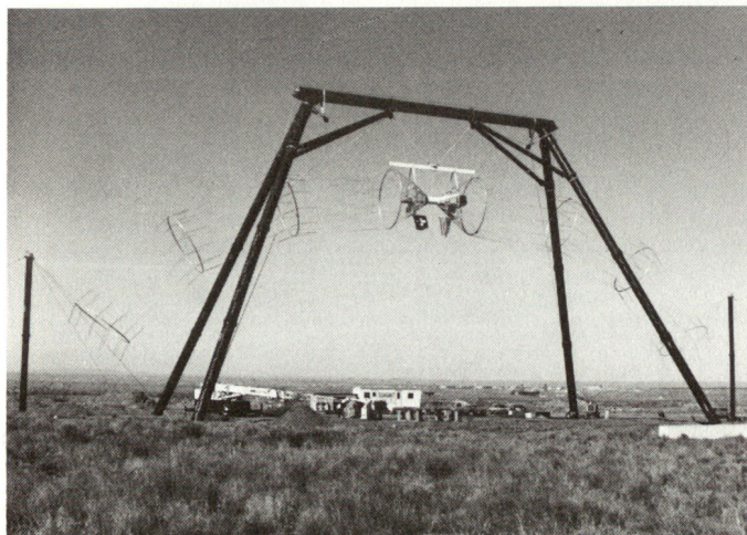
Bild 2: Der grosse, transportable EMP-Simulator (MEMPS) in der Werkerprobungsphase in Albuquerque (USA).

Im bestehenden EMP-Simulator können Objekte bis zur Grösse eines Gelände-PWs dem EMP einer Hochexplosion ausgesetzt werden. In Bild 2 ist die grosse, transportable Prüfeinrichtung zu sehen, die zur Zeit in Beschaffung ist. Mit