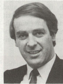
Adolf Ogi Generaldirektor Intersport Nationalrat (SVP), Präsident der Militärkommission, Fraubrunnen BE

Wie beurteilen Sie die Bedrohungslage in Europa längerfristig? Bleibt sie Realität oder sehen Sie Anzeichen eines echten Abbaus der Bedrohung?