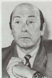
Bundesverteidigungsminister Dr. Manfred Wörner

Schon seit längerer Zeit und immer mehr verlagert die Sowjetunion ihr Gewicht auf die sogenannte Indirekte Stra-