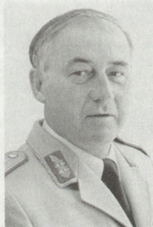
General Wolfgang Altenburg, Generalinspekteur der Bundeswehr

Antwort: Wenn die Verteidigung erfolgreich geführt werden soll, muss die eigene Führung Informationen über den Gegner besitzen, die sie befähigen, seine geplante Gefechtsführung zu erkennen und mit Feuer und Bewegung zu reagieren. Die zahlenmässige Über-