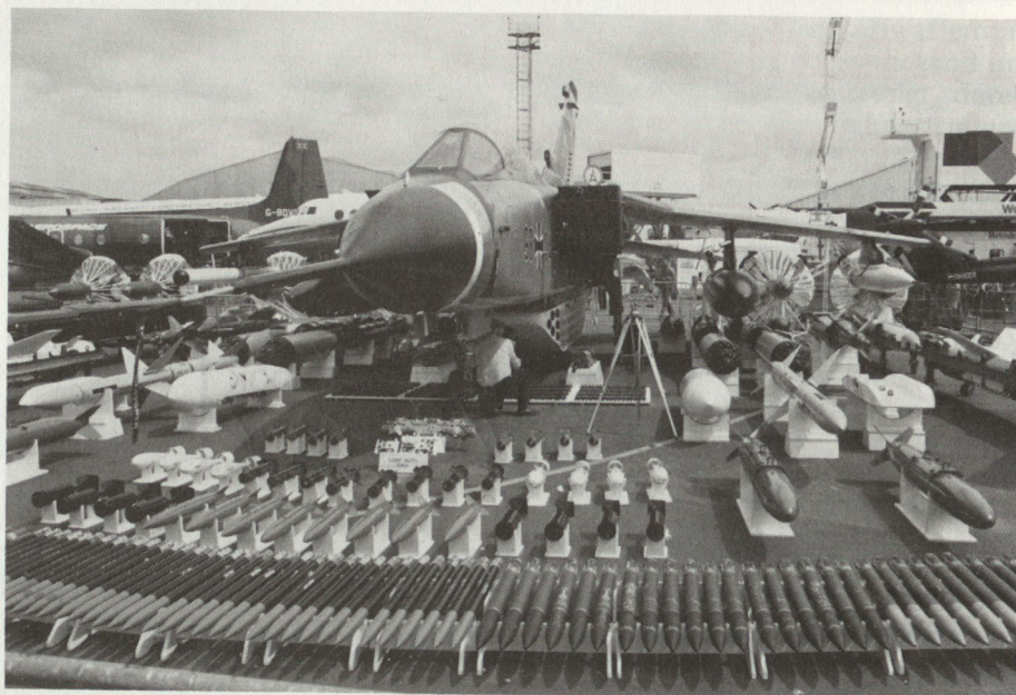
Bild 1. Waffendisplay der Tornado Interdiction-/Strikeversion der Bundeswehr. Unter dem Rumpf sieht man die Hauptbewaffnung, den MW-1 Behälter mit Submunition.