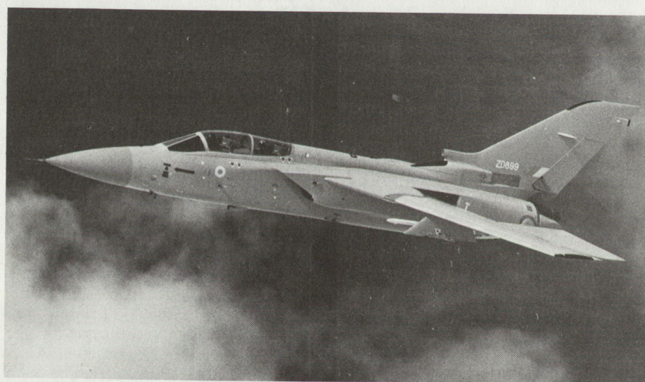
Bild 2. Tornado-Abfangjäger ADV der Royal Air Force. Saudi-Arabien und Oman haben sich ebenfalls zum Kauf dieser Version entschieden.