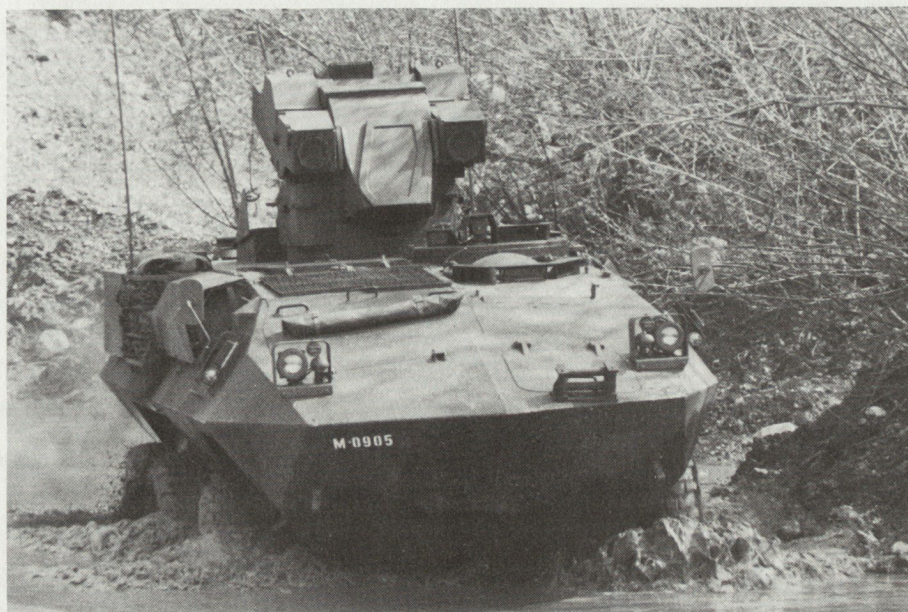
Seit 1983 waren Teile der Pzaw Kp 28 bei allen Truppenversuchen mit dem Panzerjäger dabei.