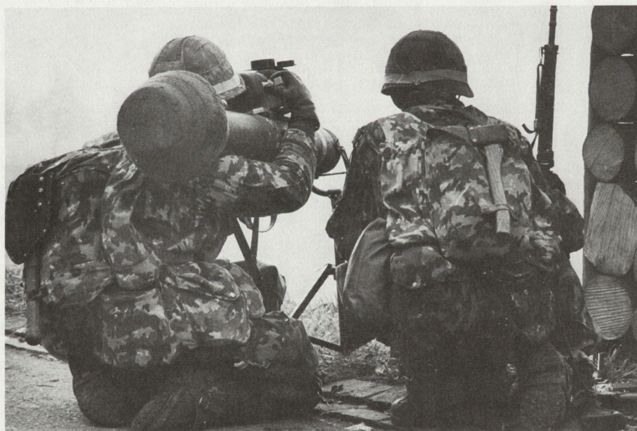
Auch die Infanterie ist heute beweglich und panzerabwehrstark. Dragoneinsatz während der Übung Dreizack im November 1986. Hier in der ungewohnten Rolle der angreifenden Partei.