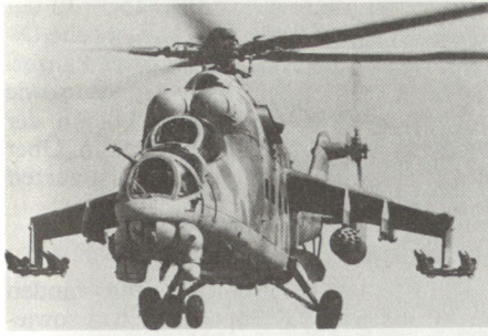
Kampfhelikopter Mi-24 HIND-D, der in der NVA auch als fliegender Kampfschützenpanzer bezeichnet wird.