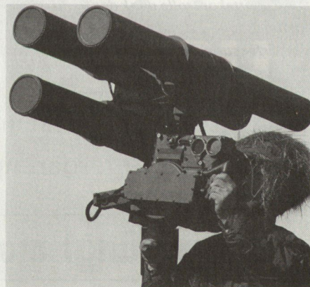
Starstreak Dreifachstarter auf Bodenlafette