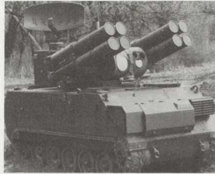
Mobile ADATS-Version auf Schützenpanzer M-113 (von Kanada gewählt)

Information fast ausschliesslich mit Mi-8 versehen ist.