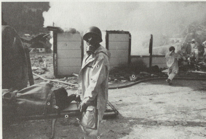
Luftschutzformationen im Einsatz bei Grossschadenlagen.

In einer weiteren Phase der Übung unterstützten die Luftschutztruppen ortsfeste wie auch Kampftruppen bei Bewachungs- und Sicherungsaufträgen. Auf Anforderung der zuständigen Behörden kamen in vier grossangelegten Schadenlagen Luftschutzformatio-