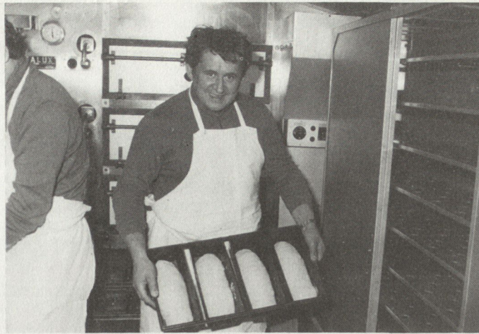
In den mobilen Bäckereien wurden 16 Tonnen Brot gebacken.

Mit 15 000 Kanistern, 6 Tankwagen mit Anhängern, 5 Tankanlagen, 8 Eisenbahnzisternen und 6 Materialanhängern wurden 295 000 Liter Diesel, 182 000 Liter Benzin sowie 3600 kg Betriebs- und Schmiermittel umgesetzt.