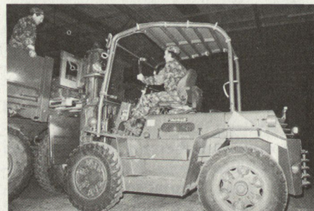
4400 Tonnen Munition wurden verschoben.

Insgesamt produzierten die Versorgungsdienste rund 23 Tonnen Fleisch und 16 Tonnen Brot. Es wurden 70 Tonnen Armeeproviant und 2 Tonnen Käse verbraucht. Gesamthaft waren 175 000 Manntage zu versorgen.