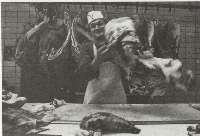
Die Metzgerzüge verarbeiteten 32 Tonnen Fleisch.