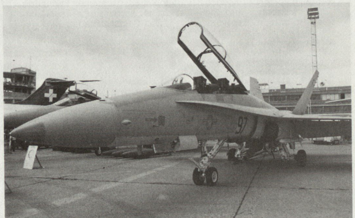
Zweisitzige F-18-Version am «Salon aéronautique de Paris» 1983.