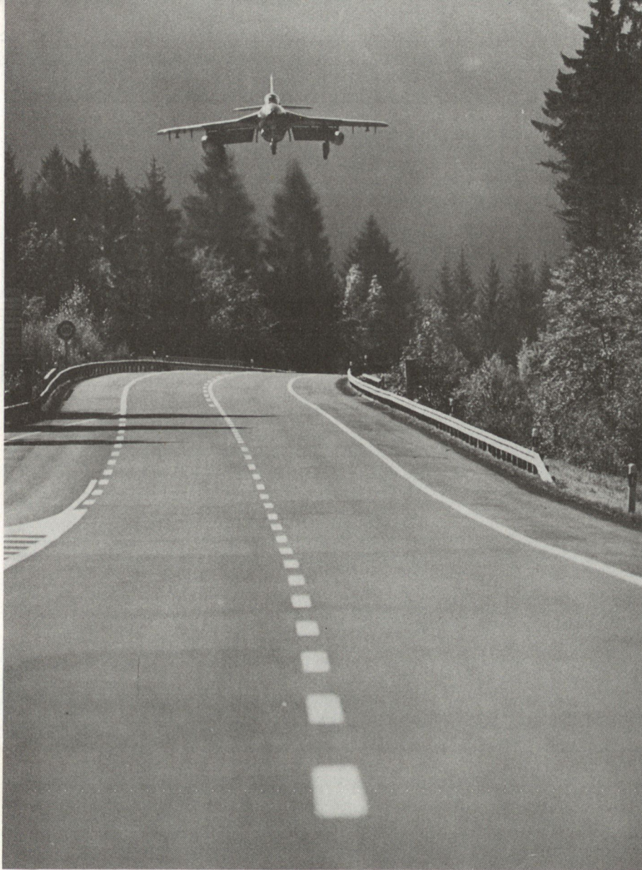
Nicht nur Autobahnen, auch Nationalstrassenabschnitte 2. Klasse eignen sich für Notstarts und Landungen mit Kampfflugzeugen.

personal des BAMF besetzt, wie etwa Chefmechaniker, Flugsicherungspersonal, Kontrolleure, technische Offiziere usw. Pro Flugplatzabteilung sind – je nach Flugzeugtyp und Flugplatz – 17 bis 27, pro Flugplatzregiment 70 bis 90 solcher Spezialisten eingeteilt. Weitere 10 bis 20 stehen als Fachlehrer der Flugplatzabteilung im Kadervorkurs und vor Beginn des Flugbetriebes für die Ausbildung zur Verfügung.