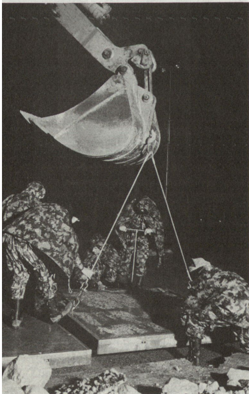
Mit modernen Baumaschinen sorgt die Fliegergeniekompanie für eine schnelle Reparatur beschädigter Pisten. Natürlich im Einsatz rund um die Uhr!

In der Zusammenarbeit mit der Berufsorganisation des Bundesamtes für Militärflugplätze (BAMF) und seiner militärischen Formation – dem Flieger- und Flab-Park 35 – existiert eine sehr