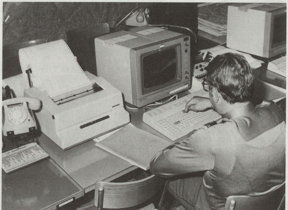
Der Einsatz von EDV ist längst nicht mehr wegzudenken. Der Flugplatzbrigade 32 steht ein Informationssystem für den taktischen Einsatz zur Verfügung, mit Daten über die Mittel und die Rahmenbedingungen.

zweckmässige, effiziente Lösung. Versorgungs-, Wartungs- und Reparaturarbeiten auf höherer Stufe werden durch diese Organe durchgeführt (vgl. Grafik). Zudem sind gewisse Schlüsselfunktionen innerhalb der Organisation der Miliztruppe durch Berufs-