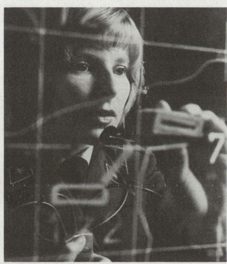
Viele der 16 000 Angehörigen der Flugplatzbrigade 32 sind Frauen. In den Einsatzzentralen sind sie in den vielfältigsten Funktionen tätig.

mengefasst, die sich nicht direkt mit dem Flugzeug befassen: Flugsicherung, Munitionstransport, Unfallpikett, Werkbetrieb, Übermittlung, Sanität und Motorwagendienst. Für die Bereitstellung der Flugzeuge ist die Fliegerkompanie zuständig. Sie sorgt für die Wartung, für die Munitionierung, das Auftanken und die zahlreichen Kontrollen im und am Flugzeug. Mit den Reparaturen befasst sich die Flugzeugreparaturkompanie. Hier finden sich die Triebwerk-, Funk-, Geräte- und Waffenmechaniker. Sie führen auch periodische Kontrollen an den Flugzeugen durch. Aufgabe der Fliegergeniekompanie ist es, Kriegsschäden an Pisten und Rollwegen zu beheben sowie Geländeverstärkungen auf dem Flugplatz zu erstellen und auszubauen. Diese Einheit verfügt sowohl über Baufachleute wie auch über die notwendigen Baumaschinen und -geräte.