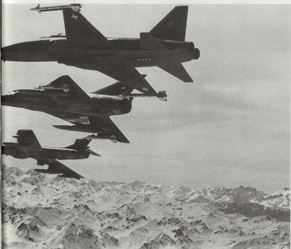
Welcher Flugzeugtyp auch immer: Die Flugplatzbrigade 32 stellt auf jedem Flugplatz den Einsatz der Kampf- und Leichtflugzeuge sicher. Das ist ihr Auftrag.