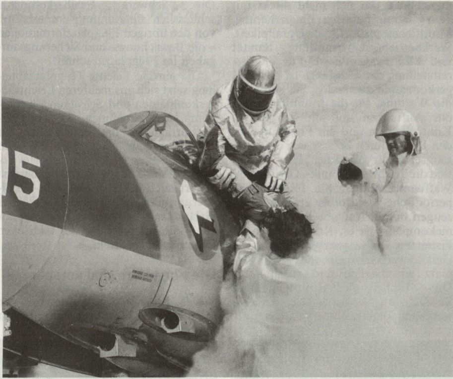
Das Unfallpikett ist ständig bereit, mit Brandbekämpfungsmitteln und Sanitätsambulanzen auf der Piste einzugreifen. Regelmässig wird unter realistischen Bedingungen geübt.

Bestandteil des Logistikkonzeptes der Flieger- und Fliegerabwehrtruppen. Um diesen Grundsatz in allen strategischen Fällen einhalten zu können, sind die verschiedensten Anforderungen zu erfüllen. Die stetige Versorgung mit Material (Ersatzmaterial, Flugpetrol usw.) und Munition steht dabei im Vordergrund, um Flugzeuge, Infrastrukturanlagen, Radargeräte und Flugsicherungseinrichtungen betreiben, warten und reparieren zu können. Dabei kommt der Behebung von Kriegsschäden an Material und Infrastruktur eine besonders grosse Bedeutung zu.