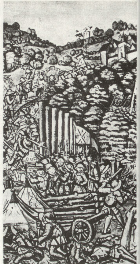
Letzi von Frastanz nach der Schweizer Bilderchronik des Luzerners Diebold Schilling