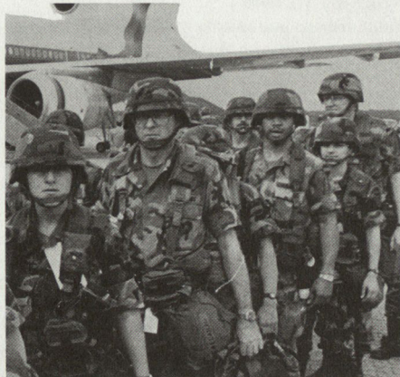
Landung amerikanischer Truppen in Deutschland anlässlich der strategischen Verlegeübung REFORGER 87.

REFORGER (REturn of FORces to GERmany) ist eine in der Regel jährlich stattfindende strategische Verlegeübung unter Beteiligung von Teilen des amerikanischen Heeres, der Marine und der Luftwaffe mit dem gemeinsamen Auftrag, Truppen von den USA nach Europa und zurück zu transportieren. Diese Verlegeübungen dienen zugleich der Glaubwürdigkeit der NATO-Abschreckung.