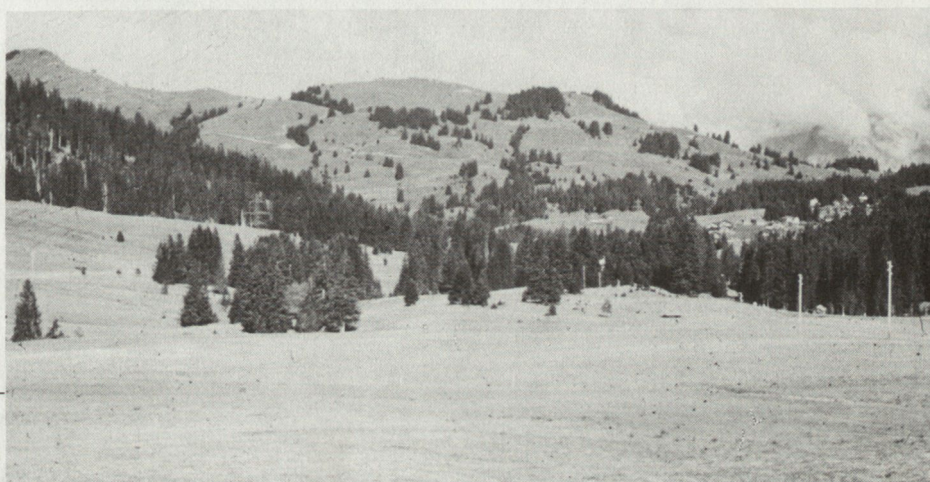
Col des Mosses

Aaretal, das Gebiet des Thunersees und die Haute-Gruyère, aber auch das Chablais (Rhonetal zwischen Martigny und Genfersee) und das Goms zu Abschnitten von erstrangiger Bedeutung.