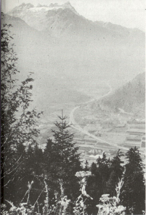
Kessel von Martigny

Bergkette des Alpenbogens, der Mitteleuropa von Norditalien trennt, kann Planung und Ablauf militärischer Operationen sehr begünstigen (So bildet zum Beispiel der Grosse St. Bernhard zusammen mit der Rochade des Simplons eine der drei grossen Achsen von europäischer Bedeutung, welche unser Land durchqueren; er ist überdies topographisch wie militärisch die kürzeste Verbindung zwischen der Po-Ebene und dem schweizerischen Mittelland);