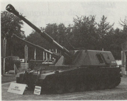
Prototyp der bereits 1986 erstmals vorgestellten britischen Panzerhaubitze AS-90, die vermutlich als Konkurrent der Neuentwicklung Panzerhaubitze 2000 anzusehen ist.

zu entwickelnden Fahrgestell) und Rheinmetall (Turm) beteiligt. Innerhalb der nächsten 24 Monate sollen in einer «Stufe I» die beiden Konzepte durchkonstruiert und anschliessend erprobt werden. Hierfür sind zwischen 1988 und 1991 insgesamt 189 Mio DM eingeplant, die auf die beiden Konsortien aufgeteilt werden.