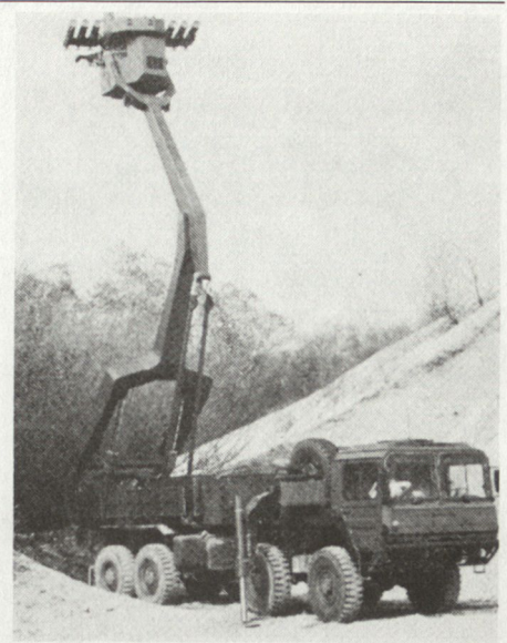
Waffensystem HOT/EPLA (Elevierbare Plattform) auf einem schweren Geländelastwagen MAN mit Elevationseinrichtung und Kampfplattform mit sechs PAL HOT.

Der einsatzbereite Prototyp «Elevierbare Kampfplattform auf Radfahrzeug» wurde gemeinsam von den Firmen MBB, KM und MAN entwickelt. Dieses Konzept enthält erstmals die volle Nutzung der dritten Dimension und erreicht damit eine wesentlich grössere Tiefenleistung (Waffenreichweite) als bodengestützte Lenk Waffen. Durch die Elevation von 3 bis maximal 13 m wird die Beobachtung, Identifizierung und wirksame