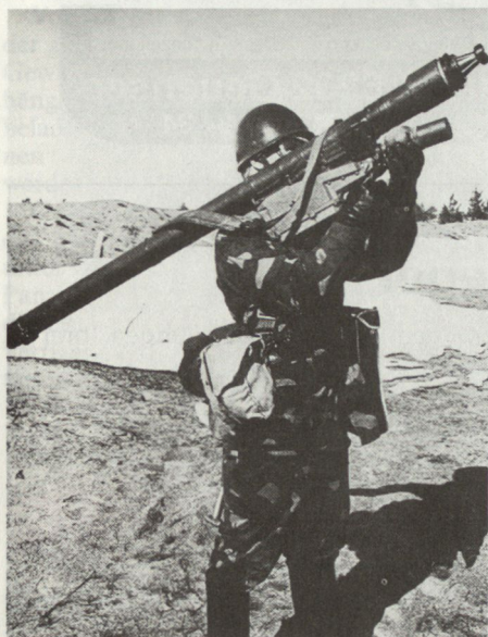
Einmann-Flab-Lenk Waffe SA-16 «IGLA», hier im Einsatz bei den finnischen Streitkräften.

Bei den Mot Schützenverbänden sind auf der untersten taktischen Stufe (Kompanie und Bataillon) eine Reihe von Massnahmen zur Verbesserung der Flab-Fähigkeit erkennbar. Mit der Bildung von Flab-Gruppen (Stufe Kompanie) und Flab-Zügen in den Mot Schützenbataillonen ist auch die Modernisierung, d. h. die Ablösung der veralteten Einmann-Flab-Lenk Waffen SA-7 durch die neuen SA-14 und SA-16 im Gange.