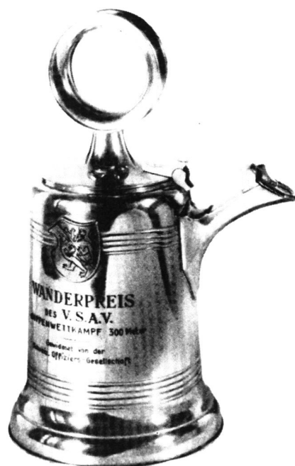
Abb. 10. Wanderpreis der SOG 1945

1945 stiftete die Schw. Offiziersgesellschaft dem VSAV einen Wanderpreis in Form einer Zinnkanne für einen Gruppenwettkampf auf 300 m (Abb. 10).