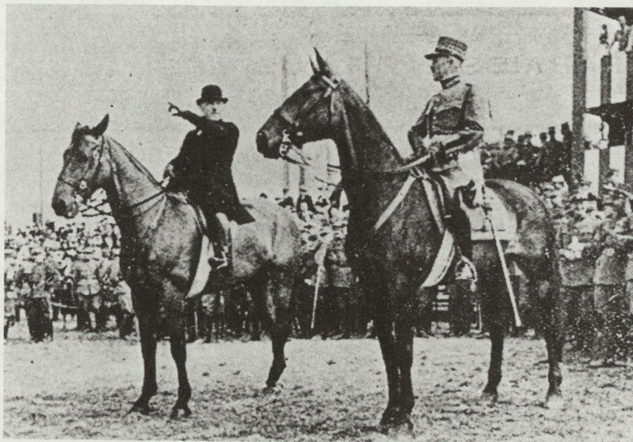
Abb. 8. Korpskommandant Henri Guisan zusammen mit Bundesrat Minger bei einem Defilée

Da damals eine grosse Anzahl Artilleristen der neu geschaffenen Waffengattung der Fliegerabwehr zugeteilt wurden, erwog man die Aufnahme der Flabisten in den VSAV. Der Waffenchef der Fliegerabwehr war dagegen, doch 1946 war es dann soweit, dass auch Angehörige anderer Waffengattungen im VSAV Aufnahme fanden.