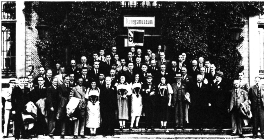
Abb. 9. Photo DV 1943 in Thun

Die Jahre 1942 und 1943 weisen rege Tätigkeiten in den Sektionen auf: 1942 192 Kurse und Übungen