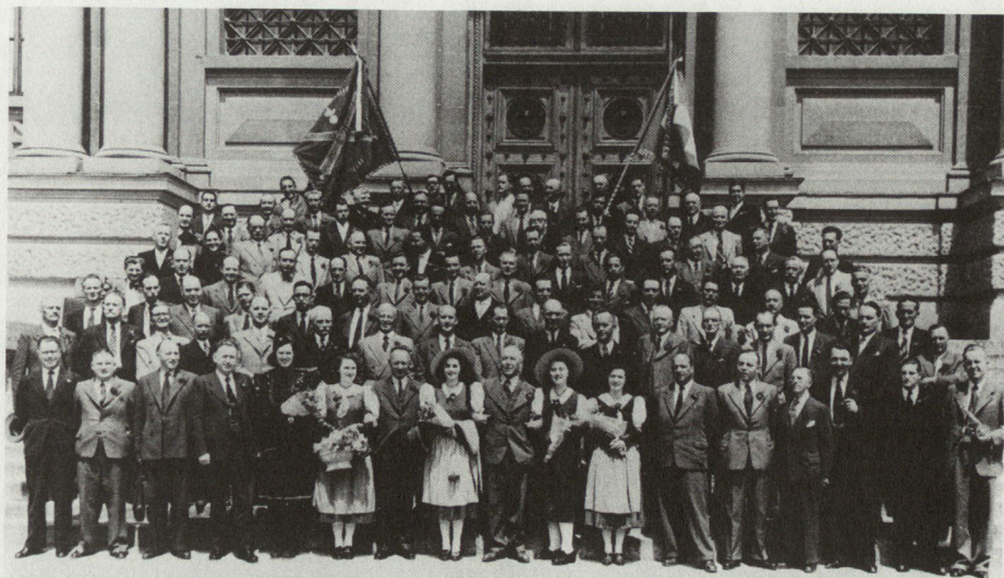
Abb. 11. DV Lausanne 1948 (mit Ehrenmitglied General Henri Guisan)