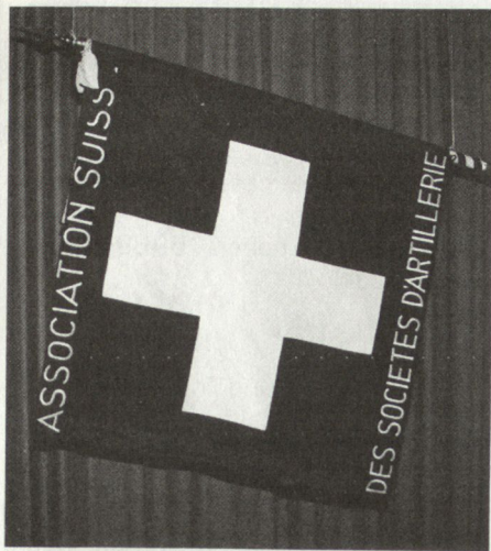
Abb. 5. Zentralfahne 1937