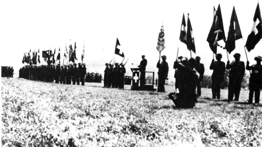
Abb. 12. Sat 1953 Luzern, Festansprache BR Kobelt