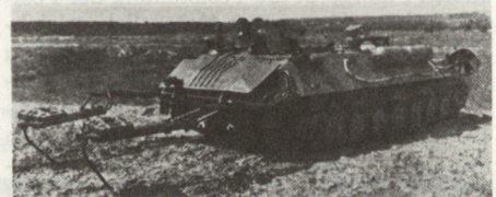
Sowjetischer Genieaufklärungsschützenpanzer IRM

Die eigentliche Hindernisbeseitigung bzw. die grosse Räumung erfolgt durch die schweren Mittel der Genietruppen. Der Kampf im überbauten Gebiet ist keine Hauptaufgabe der Pioniere. Hier werden Genieteile lediglich für die Errichtung von