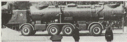
Abschussfahrzeug (ZIL-135) für die sowjetische Drohne DR-3

Im vorliegenden Beitrag werden die wichtigsten, für Aufklärungszwecke geeigneten Flugkörper mit Abbildungen beschrieben, wobei erstmals auch ein Foto des sowjetischen Drohnensystems DR-3 veröffentlicht wird.