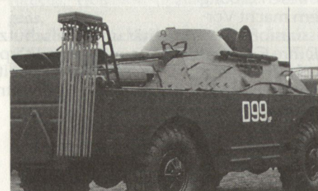
AC-Aufklärungsschützenpanzer BRDM-2/RKh; die mit Druckluft ausgestossenen Markierfähnchen dienen zur Bezeichnung verseuchter Gebiete.

Für den Vorstoss zum Fluss soll die zugeleitete AC-Aufklärungsgruppe vorausgeschickt werden, zusammen mit dem Gefechtsaufklärungstrupp. Nachdem der Chef der AC-Aufklärungsgruppe sein Fahrzeug bereit gemeldet hat, gibt ihm der Bat Stabschef die topographische Karte sowie die Signaltabelle und erteilt ihm den Aufklärungsauftrag. Er hat mit seiner Gruppe die Marschstrasse, die Entfaltungabschnitte sowie die Räume für das Abdecken der Panzer und den Verlad auf die Übersetzmittel aufzuklären. Mit besonderer Sorgfalt soll geprüft werden, ob auf den Zugangswegen zum Fluss und den Übersetzstellen Kernminen oder chemische Minen vorhanden sind. Bei verseuchten Zonen sind vordere und hintere Begrenzung im Gelände zu markieren, dazu alle 2 bis 3 Kilometer eine Tafel am Strassenrand mit Angabe des Strahlenpegels. Bei Gebieten mit mehr als 100 Röntgen/Std muss eine Umfahrung gesucht werden. In der Marschkolonne des Bat fahren speziell ausgebildete «chemische Beobachter» auf den Aufklärungsfahrzeugen mit. Die Panzerkompanie hält eine Besatzung zum Einsatz bei der Aufklärung von Zonen hohen Strahlenpegels bereit.