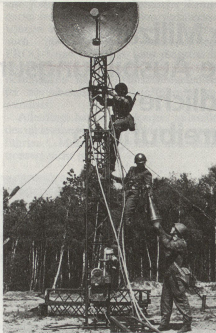
Aufbau einer sowjetischen Richtstrahlstation der 400er-Serie.

Arbeitsplatz 3: Ausrüsten des Mastkopfes, Aufstellen des Hebezeuges in die vertikale Position, Montage des Mastes, Tarnen der Antennen-Mast-Anlage. Der Standort ist bereits ausgepflockt, die Spiralbohrer sind gesetzt und die Grundplatte verlegt. Das Antennenspeisekabel wird von der Trommel abgewickelt, die Spulen der Getriebekabel werden bereitgelegt, das Starkstromkabel zum Anschluss des elektrischen Antriebs des Hebezeuges wird vorbereitet. Dies sind die verantwortungsvollsten und schwierigsten Tätigkeiten beim Stellungsbezug einer Richtstrahlstation.