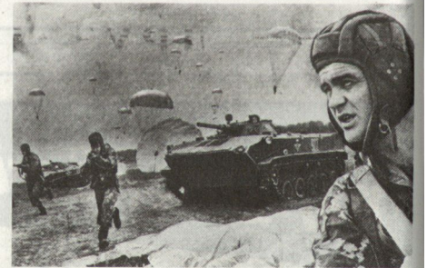
Absetzen sowjetischer Luftlandtruppen mit BMD.

Die diversen Fahrzeugbesatzungen machen sich auf die Suche nach den ebenfalls an Fallschirmen abgeworfenen Fahrzeugen, wobei ihnen funktechnische Mittel gute Dienste leisten. Sobald sie ihre Luftlandpanzer BMD gefunden haben, machen sie diese von den Befestigungen los und fahren zum Sammelplatz.