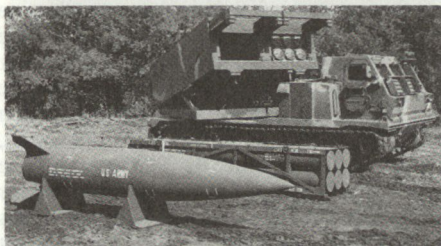
Taktische Lenkwaffe ATACMS, die ab Mehrfach-Raketenwerfer MLRS verschossen wird. Die Rakete ist mit einem modernen Trägheitsnavigationssystem ausgerüstet.

– Im weiteren soll die kontinuierliche Leistungssteigerung von Trägermitteln für Mehrzweckwaffen (u. a. auch für die neuen nuklearen Abstands Waffen), wie etwa des Mehrzweckkampfflugzeugs TORNADO in die Wege geleitet werden.