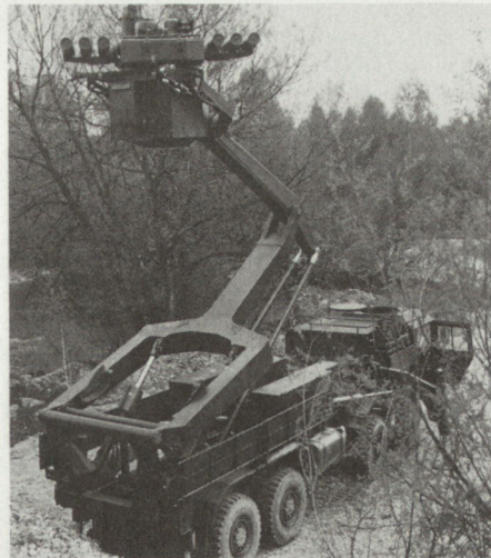
Das neu für die deutsche Bundeswehr geplante Pzaw-System PANTER mit total 6 PAL HOT auf einer elevierbaren Abschussplattform.

Seit der Einführung der PAL-Systeme MILAN und HOT bei der deutschen Bundeswehr sind bereits mehr als 20 Jahre vergangen. Die Nutzungsphase für beide Systeme wird aber vermutlich bis über das Jahr 2000 hinausreichen. Die sich daraus ergebende Lebensdauer von fast 40 Jahren erfordert eine ständige Anpassung an eine sich rasch ändernde Bedrohungssituation und den entsprechenden militärischen Forderungen.