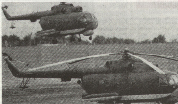
Mi-14BT ohne aufgeblasene Stützwimmer.

Der Mi-14 wurde speziell für den Einsatz über See entwickelt. Er entstand auf der Basis des Mehrzweckhelikopters Mi-8. Ausgerüstet mit modernen Navigations-, Funkmess- und Spezialgeräten ist dieser Marinehubschrauber in der Lage, vielfältige Aufgaben unter schwierigen Wetterbedingungen am Tage und in der Nacht zu lösen. Dazu gehören u. a. das Aufklären und Bekämpfen von U-Booten, die Suche und das Räumen von Minen, Seenotrettungs-, Seeaufklärungs- und Transportaufgaben. Ein mit dem Autopilot gekoppeltes Doppelnavigationssystem ermöglicht das genaue Einhalten der verschiedenen Flugzustände beim Lösen dieser Spezialaufgaben. Die