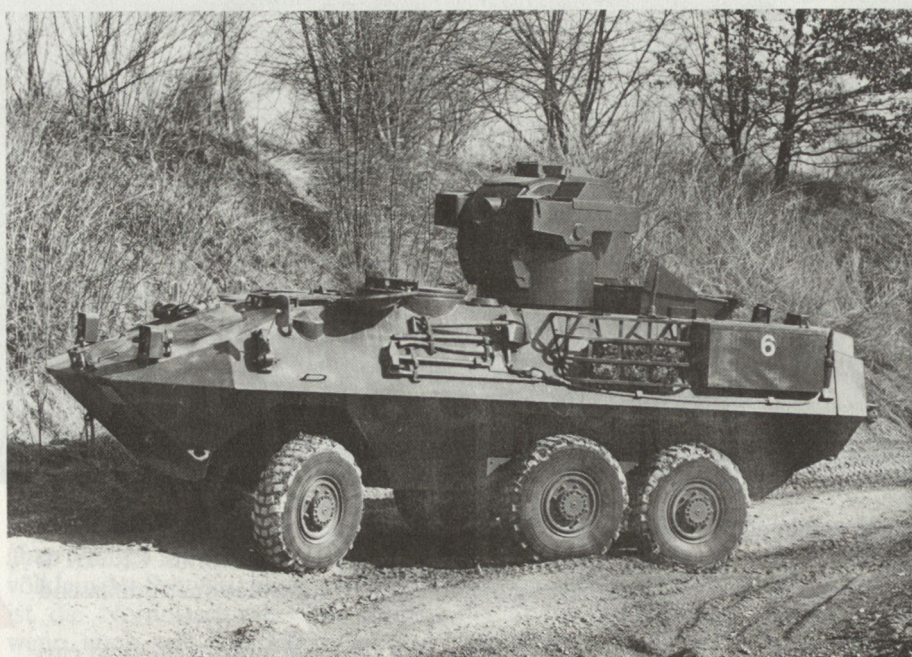
Der in der Einführung stehende «Piranha» bringt eine hohe Kampfkraftsteigerung in der Panzerabwehr. Er wird in der Ostschweiz hergestellt.

Die frühere Grenzdivision 7, gemäss der TO 61, ist in vielen einzelnen Schritten laufend der sich ändernden Bedrohung angepasst und dadurch zur heutigen Felddivision 7 geworden. Zahlreich sind die Änderungen der Ausrüstung im Vergleich mit den sechziger Jahren – ebenso bedeutsam sind aber die Konstanten in der Truppe selbst. Der Bundesrat hatte in seinem Bericht zum Armeeleitbild 80 vom 29. September 1975 die Folgerungen für