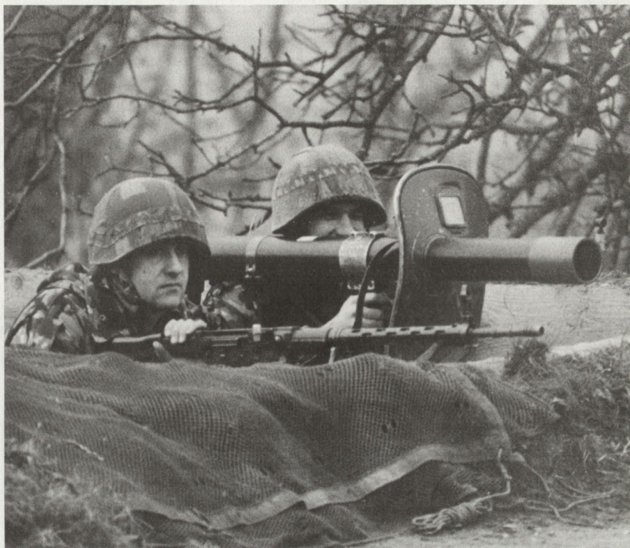
Auf den Ostschweizer ist Verlass. Er weiss, dass er in seinem Raum im Ernstfall seine Bewährungsprobe zu bestehen hat. (Aus Buch FAK 4, Übung «Dreizack '86»)

Die Kampfkraft der Division wird entscheidend mitbestimmt durch die mit ihr eng verbundenen Grenzbriga-