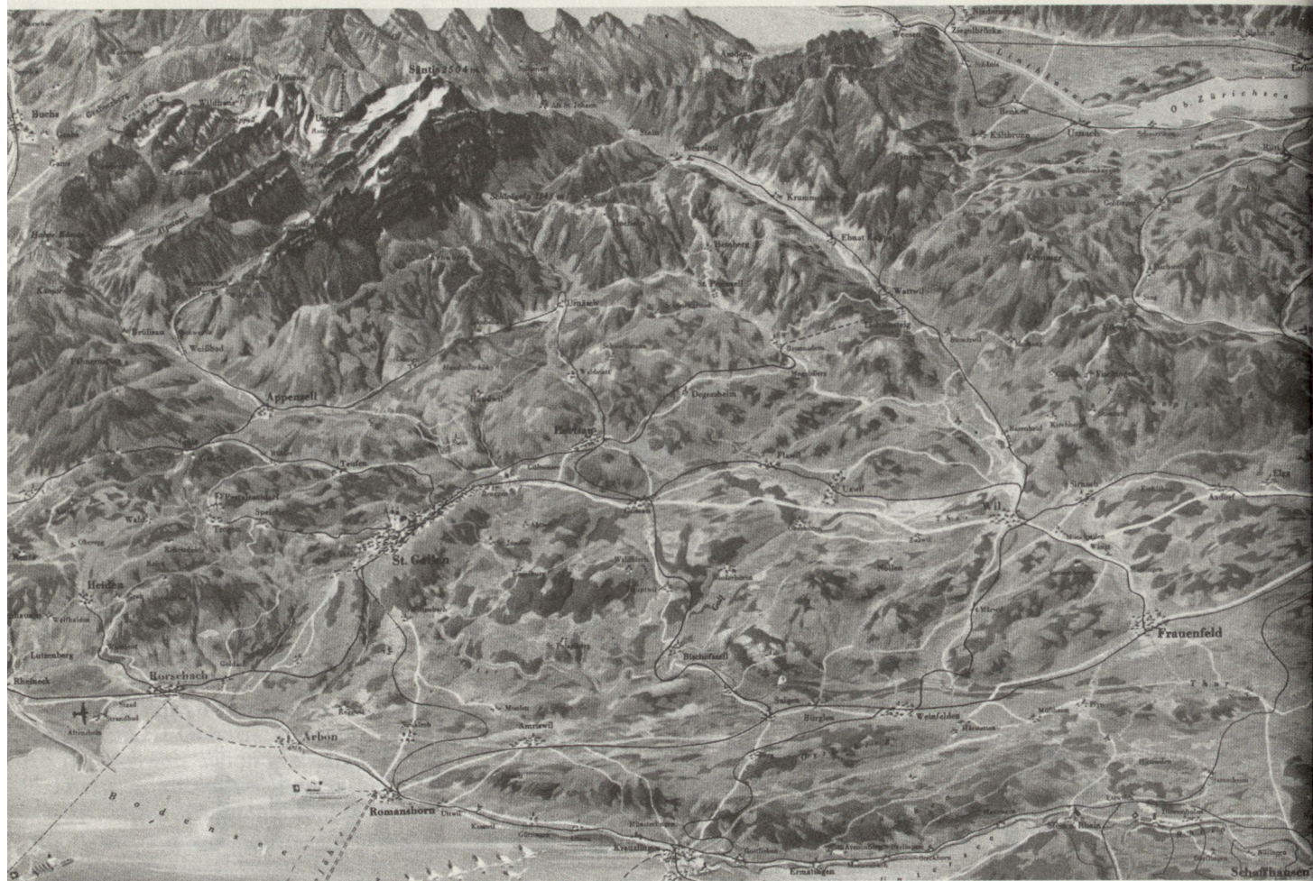
Der Einsatzraum der Division auf einen Blick: Gut erkennbar ist der natürliche Grenzverlauf (Bodensee und Rhein), der panzergängige, der infanteriestarke und der alpine Abschnitt. (Aus Buch «Die 7. Division»)

Kantone Schaffhausen, Zürich und Glarus zu ihrem Bestand. Ihr Gebiet erstreckt sich über die ganze Ostschweiz. Höchst unterschiedlich präsentiert sich dabei das Gelände, welches in einem Ernstfall zu verteidigen ist: Der von sanften Hügelzügen charakterisierte Kanton Thurgau, dessen natürliche Grenze im Norden der Bodensee bildet, weist einige grosse Ebenen auf, die durch das Autobahnnetz gut erschlossen sind. Auch viele Nebenachsen in diesem Gebiet sind gut ausgebaut; die Panzergängigkeit des Geländes wird allerdings durch viele Ortschaften, bewaldete Gebiete und eine Vielzahl von Bachgräben beeinträchtigt. Eine ausgesprochen vielgestaltige topographische Situation zeigt sich im Kanton St. Gallen mit der gleichnamigen Hauptstadt, welche militärisch für einen Gegner ein wesentliches Hindernis auf der Hauptachse, der Nationalstrasse N1, bildet. Im südlichen Divisionsraum, in den beiden Kantonen Appenzell und im Toggenburg liegt voralpines Gelände, das im Alpsteingebiet eigentlichen Gebirgscharakter trägt.