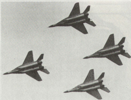
Sowjetische Mehrzweck-Jäger FULCRUM anlässlich eines MiG-29-Demonstrationsfluges in Finnland im Jahre 1986.

Bei der vorgesehenen finnischen Evaluation kommt es somit erstmals zu einem direkten Vergleich zwischen westlichen und östlichen Kampfflugzeugen. Schon heute steht mit ziemlich grosser Sicherheit fest, dass nebst einer Anzahl MiG-29-Maschinen auch eine kleinere Stückzahl eines der noch im Rennen liegenden westlichen Flugzeuges beschafft werden wird.