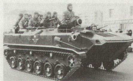
Die Transportversion des BMD-Luftlandpanzers kann neben der Besatzung noch 8 bis 10 Fallschirmjäger transportieren.

Ein weiteres Beispiel der laufenden Mechanisierung bei den Luftlandverbänden ist der Transport-Luftlandpanzer BMD M-79/1, der anlässlich der letzten Oktoberparade in Moskau gezeigt wurde.