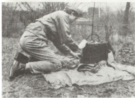
Bei der vormilitärischen Laufbahnausbildung «Nachrichtenspezialist»: Ein Funkgerät wird entfaltet.

zweige, die dem künftigen Nachrichtensoldaten zur Vorbereitung des Wehrdienstes von Nutzen sein kann. Ausbildungsgebiete sind: