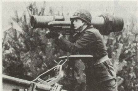
Schweden führt mit dem «Top-Attack-PAL-System» Bill als erste Armee der Welt eine Pzaw-Waffe dieser Art ein.

Für die noch 20 verbleibenden Kampfbrigaden ist eine Mannschaftsstärke von je zirka 5000 Mann geplant. Als Hauptträger der Abschreckung oder eines allfälligen Abwehrkampfes sollen sie eine verbesserte Ausrüstung und Bewaffnung erhalten. Die sechs Panzer- und mechanisierten Brigaden sollen insbesondere die neuen Kampffahrzeuge der SA90-Familie erhalten, während als Schwerpunkt die Panzerabwehr mit fol-