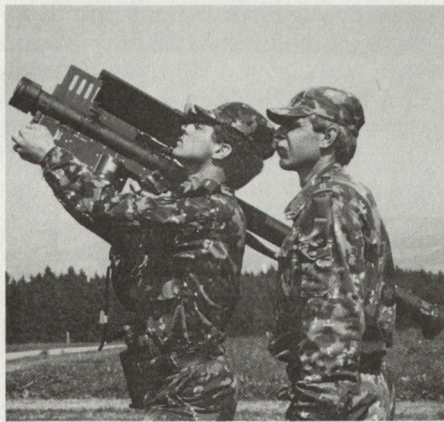
Abb. 3: L Flab Lwf Stinger (USA)

diese selbst zu handhabenden Mitteln bedarf.» Allerdings – die L Flab Lwf darf es nicht sein, und so bricht er eine Lanze für die MK 25 mm, denn, so steht es in der ASMZ 9/88, «sie gäbe dem Infanteristen einen (verlängerten Arm) gegen Helikopter und leicht gepanzerte Kräfte des Gegners bis auf rund 1500 m.»