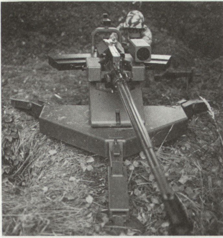
Abb. 2: L Flab Lwf Mistral (Frankreich)