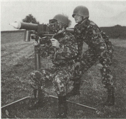
Abb. 2: L Flab Lwf Mistral (Frankreich)