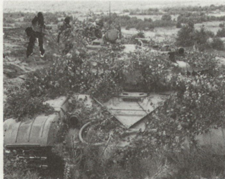
WAPA-Kampfpanzer T-72 in einer Verteidigungsstellung; aufgenommen anlässlich von diesjährigen Manövern in der DDR (Anmerkung Red.).

Insbesondere Feldbefestigungen und Geländeverstärkungen helfen mit, die Kampfkraft von Menschen und Material zu verbessern. Leider wurde dieser Tatsache in den letzten Jahren zu wenig Beachtung geschenkt.