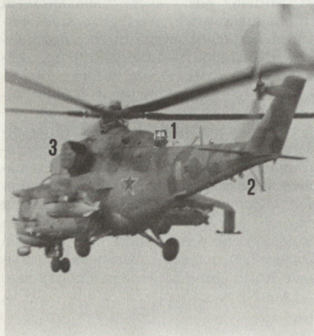
Versionen des Mi-24 werden in den Streitkräften folgender Länder geflogen: UdSSR, Afghanistan, Algerien, Angola, Aethiopien, Bulgarien, CSSR, DDR, Irak, Iran, VDR Jemen, Nicaragua, Libyen, Polen, Syrien und Ungarn. H.G. (Aus Nr. 36/88)

Neben äusserlich sichtbaren Veränderungen gibt es bei den unterschiedlichen Versionen natürlich solche, die die Ausrüstung, die Instrumentierung oder den Antrieb betreffen. So sind an die Stelle der beiden Triebwerke TW2-117 A der ersten Mi-24-Serien die leistungsstärkeren TW3-117W getreten. Weitere Änderungen betreffen Infrarot-Störstrahler oben am Heckauslegeransatz (Pt. 1), eine Doppelwurfanlage (2) vor der Stabilisierungsflosse unten am Heckausleger sowie kastenförmige Ummantelungen an den seitlichen Abgasrohren (3). Bezweckt wird mit der Ummantelung, dass sich die durch die vorderen Lamellen einströmende Aussenluft mit den heissen Triebwerksabgasen mischt und so die Abgastemperatur sinkt. Auf diese Art lässt sich die Strahlungsquelle für IR-gelenkte Boden-Luft-Lenk Waffen verringern. (Bild)