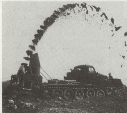
Grabenbagger MDK-2M auf Kettenfahrstell AT-T. Dieser Bagger wird gegenwärtig durch MDK-3 abgelöst (Anmerkung Red.).

Ein auf der Erdoberfläche stehender Panzer ist beispielsweise noch auf eine Distanz von 4 bis maximal 8 km erkennbar, während er in einer Grabenstellung nur noch bis Entfernungen von 1,5 bis 2 km auszumachen ist. Und zudem kann ein eingegrabener Panzer bis zu dreimal mehr Ziele vernichten, ehe er selber entdeckt und ausser Gefecht gesetzt wird.